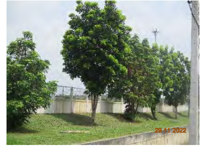
ภาพที่ 2.2-22 การปลูกต้นไม้จากบริเวณพื้นที่สีเขียวและแนวกันชน