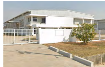
ภาพที่ 2.2-17 อาคารปิดครอบป้องกันเสียงบริเวณพื้นที่โรงงาน