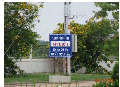
ภาพที่ 2.2-9 เครื่องหมายจราจร