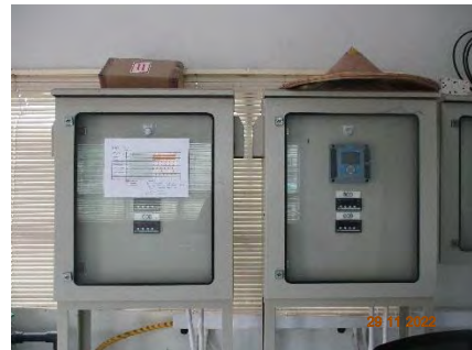
ภาพที่ 2.2-7 เครื่องตรวจวัด BOD- COD Online