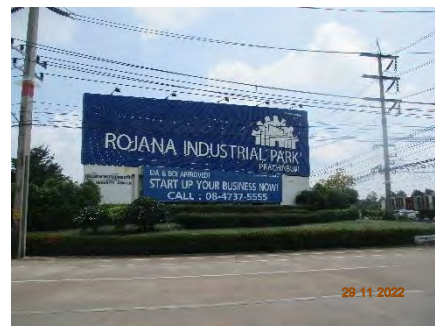
ภาพที่ 2.2-14 ศูนย์อำนวยความสะดวก ภายในโครงการ