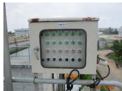
ภาพที่ 2.2-2 ระบบบำบัดน้ำเสียส่วนกลางทางชีวภาพ