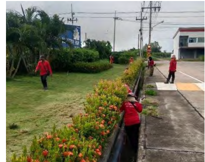
ภาพที่ 2.2-11 การกำจัดวัชพืชและปรับปรุงรางระบายน้ำ