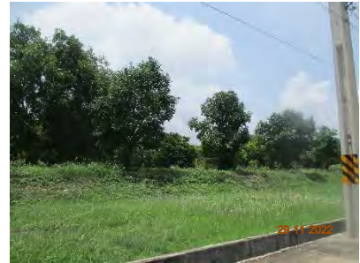
ภาพที่ 2.2-10 การปลูกหญ้าคลุมดินบริเวณพื้นที่ลาดชัน