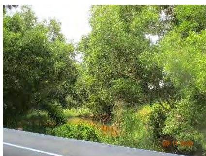
ภาพที่ 2.2-5 ระยะถอยร่น