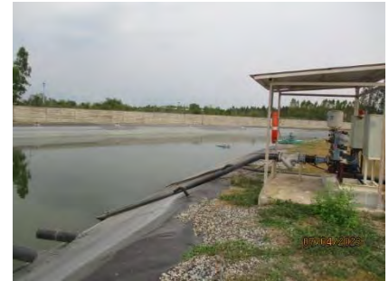
ภาพที่ 2.2-18 บ่อพักน้ำทิ้ง บริษัท ฮอนด้า ออโตโมบิล (ประเทศไทย) จำกัด