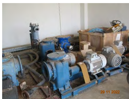
ภาพที่ 2.2-6 อะไหล่สำรองระบบบำบัดน้ำเสีย