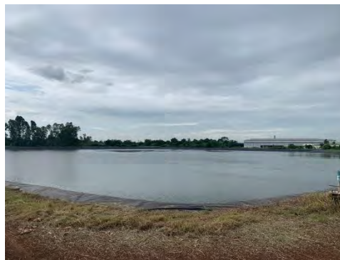
ภาพที่ 2.2-20 บ่อพักน้ำทิ้งของโครงการ