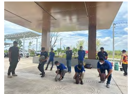
ภาพที่ 2.2-16 การซ้อมแผนฉุกเฉิน