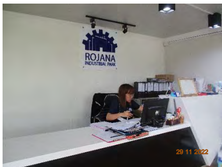
ภาพที่ 2.2-13 จุดรับเรื่องร้องเรียน