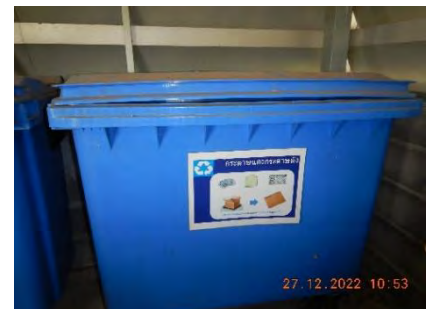
ภาพที่ 2.2-21 ถังขยะบริเวณพื้นที่โรงงาน