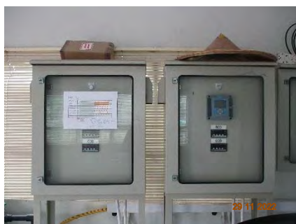
ภาพที่ 2.2-4 ศูนย์ควบคุมน้ำเสีย