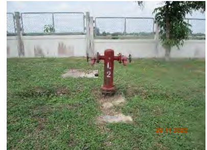
ภาพที่ 2.2-15 อุปกรณ์สำหรับตอบสนองเหตุฉุกเฉิน