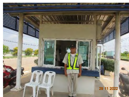
ภาพที่ 2.2-8 เจ้าหน้าที่อำนวยความสะดวกด้านการจราจรด้านหน้าโครงการ