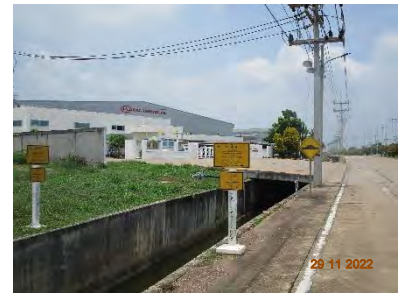
ภาพที่ 2.2-1 แนวทางท่อก๊าซ NGV